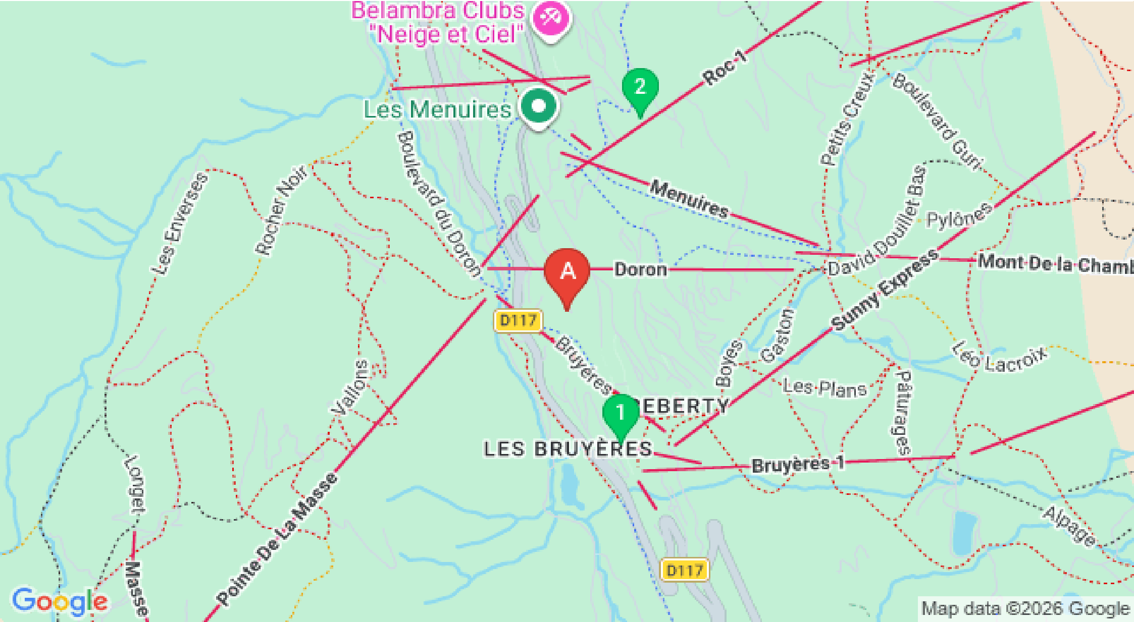
Map data ©2026 Google